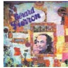
"La chanson du repêché" 33T LE CHANT DU MONDE harmonia mundi LDX 74748