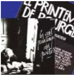
"Les cent printemps des poètes" Au printemps de Bourges 33T