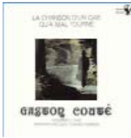
"La chanson d'un gâs qu'amal tourné" 33T disque Alvarez