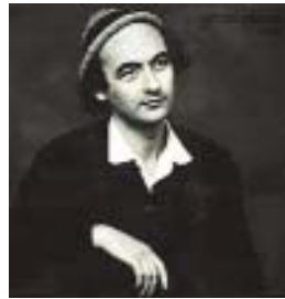
" Dame " création sur la Loire 33T LE CHANT DU MONDE harmonia mundi LDX 74790