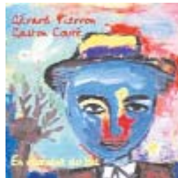
Textes de Gaston Couté " En revenant du bal " CD SARAVAH SHL 2084