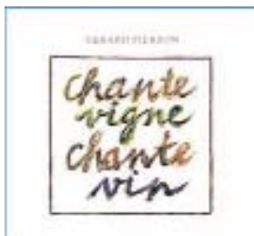
"Chante vigne chante vin" CD :LE CHANT DU MONDE harmonia mundi 2741116