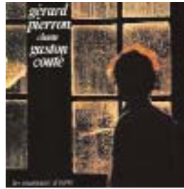
"Les mangeux d'terre" 33T LE CHANT DU MONDE harmonia mundi