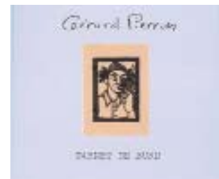
"Carnet de bord" CD : LE CHANT DU MONDE harmonia mundi 2741152